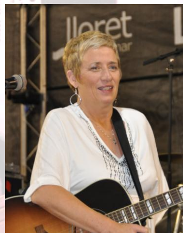
Spanish Event 2014 - Espagne

Une tournée en Europe avec son Band "The House of Twang", lui permet d'asseoir une bonne réputation; sur le festival de Cambrai, puis le Country Rendez-vous de Craponne et en Novembre elle se produit avec son groupe en Espagne sur le Spanish Event.