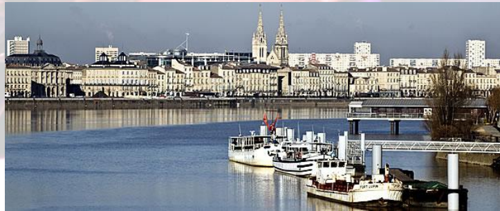
Bordeaux – France